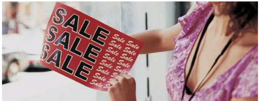
Xerox® NeverTear Window Signs

Unser speziell für Polyester-Bedruckstoffe geeigneter EA-Toner mit niedriger Schmelztemperatur wird bei der Ausgabe chemisch fest auf dem Polyester fixiert und liefert zuverlässig hervorragende Bildqualität auf Spezialdruckmaterial wie Polyester und anderen Stoffen. In Kombination mit Premium NeverTear ist unser EA-Toner widerstandsfähig gegen Wasser, Öl, Fett und Verschleiß.